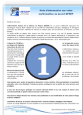
Note d'information adaptée au patient